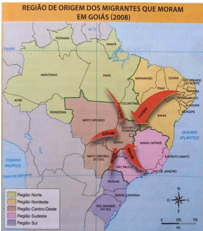
OLIVEIRA, Ivanilton José. Geografia de Goiás . Ensino Fundamental. Tadeu Arrais. São Paulo, Editora Scipione.

A leitura do mapa de 2008 sobre a origem dos migrantes que moram em Goiás mostram que, naquela década, a maior parte das pessoas vieram de